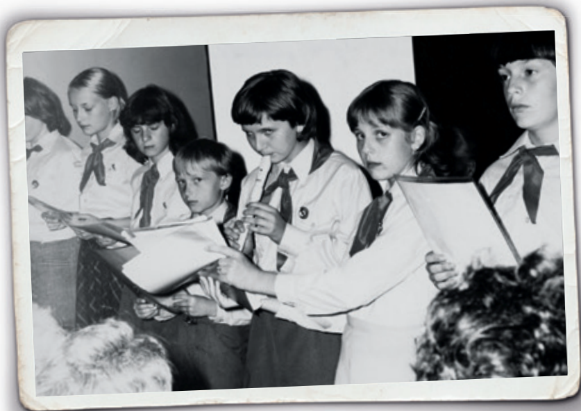
rok 1981 Poznáte se?