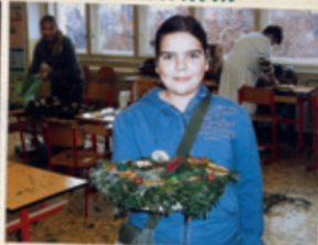
při výrobě advent. věnců