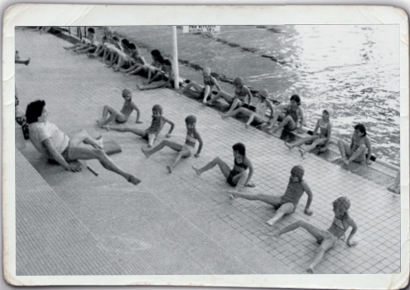
rok 1978 Mendíci se učí plavat v bazénu na Slavii